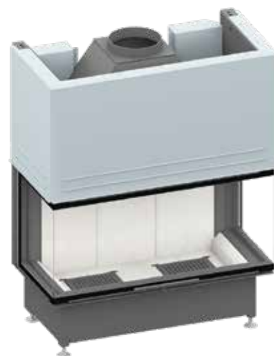
Ekko U 100(45) mit hochschiebbarer Front